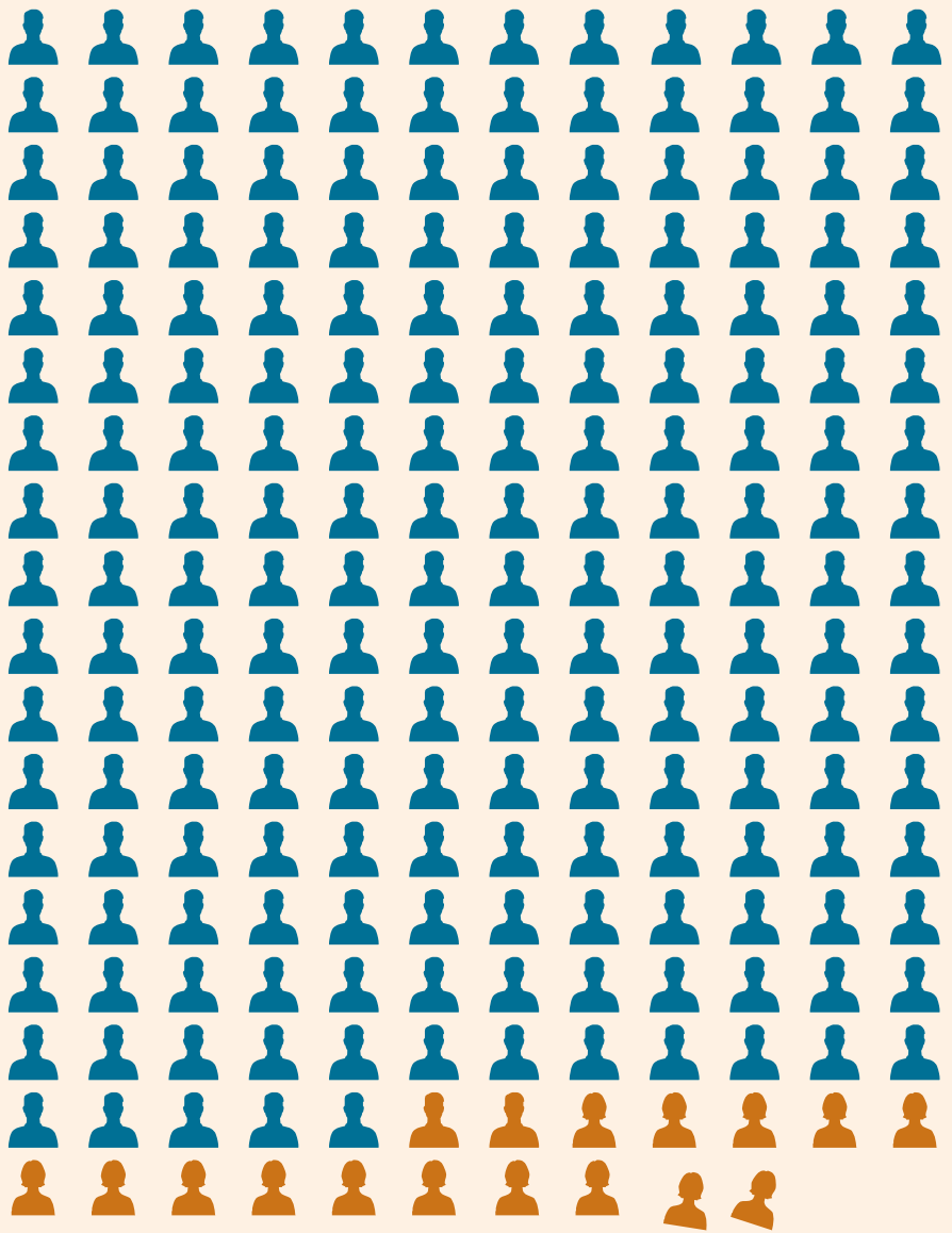
Van de 212 bestuurders zijn er nu 15 vrouw. Vorig jaar zijn twee vertrekkende vrouwen vervangen door mannen.